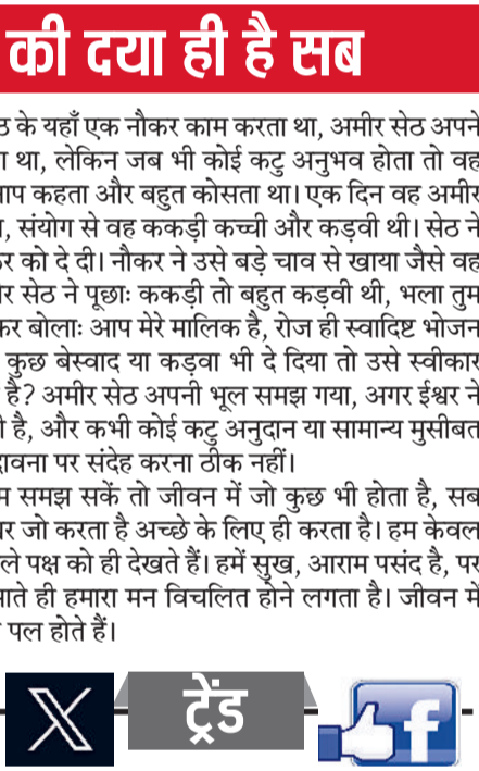
लेख पर अपनी प्रतिक्रिया haribhoomi@gmail.com पर दे सकते हैं।

भारत माता का अपमान मैं आपको पूरे विश्वास के साथ कह रहा हूँ कि कृषि समझौते भारत के किसानों के हित में हैं। कुछ लोग गलतफहमी फैलाने की कोशिश कर रहे हैं। एआई कॉन्फेस मैं जाकर कांग्रेस कार्यकर्ताओं ने कपड़े उतारे। ये भारत माता का अपमान है। -शिवराज सिंह चौहान, कैदीय कृषि मंत्री