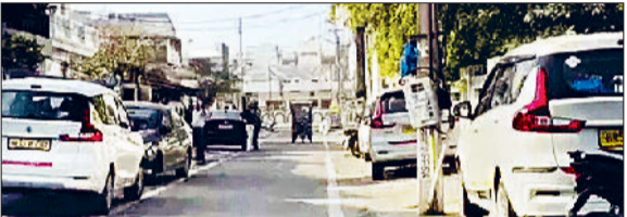
हिसार। डॉक्टर के आवास के बाहर खड़ी आयकर विभाग की गाड़ियां।

हिसार, झज्जर, रोहतक और नारनौल के अस्पतालों में चल रही कार्रवाई, आपस में अस्पतालों का बताया जा रहा है कनेक्शन, हिसार में 100 करोड़ रुपये से ज्यादा में एक अस्पताल बेचने की बात आ रही सामने